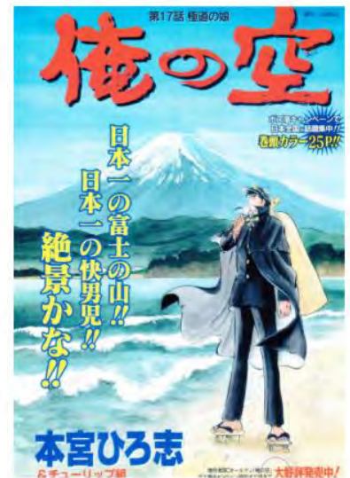
マンガ題字「俺の空」