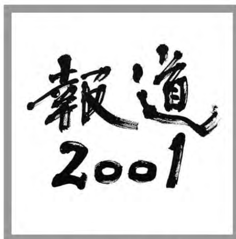
テレビ番組タイトル【報道2001】