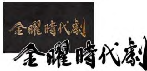
テレビ番組タイトル【金曜時代劇】