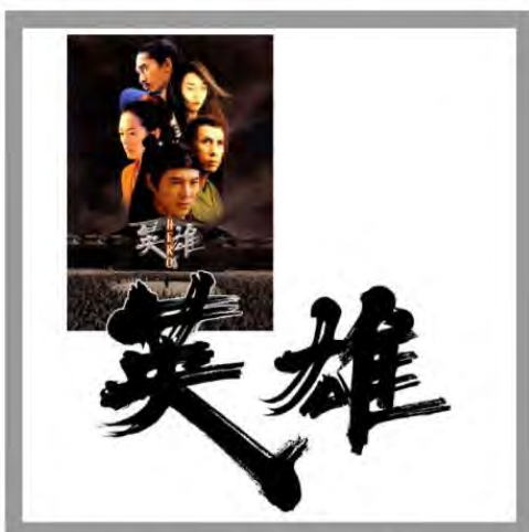
映画タイトル【英雄 ～HERO～】