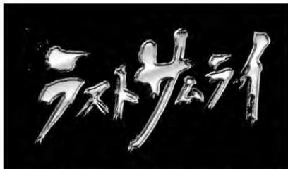
映画タイトル【ラストサムライ】